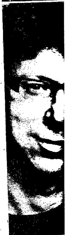
Martin Heidegger (en Amon Grunberg)