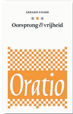
Gerard Visser: Oorsprong & vrijheid . Sijbbolet, 95 blz. € 15,95. ★★★★★