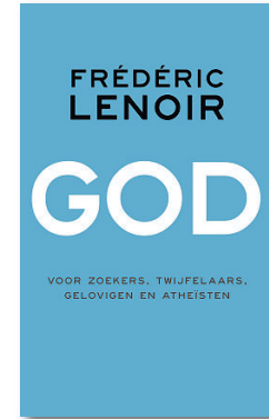
Frédéric Lenoir: God. Voor zoekers, twijfelaars, gelovigen en atheïsten . Ten Have, 224 pag. € 15,-. ★★★★★