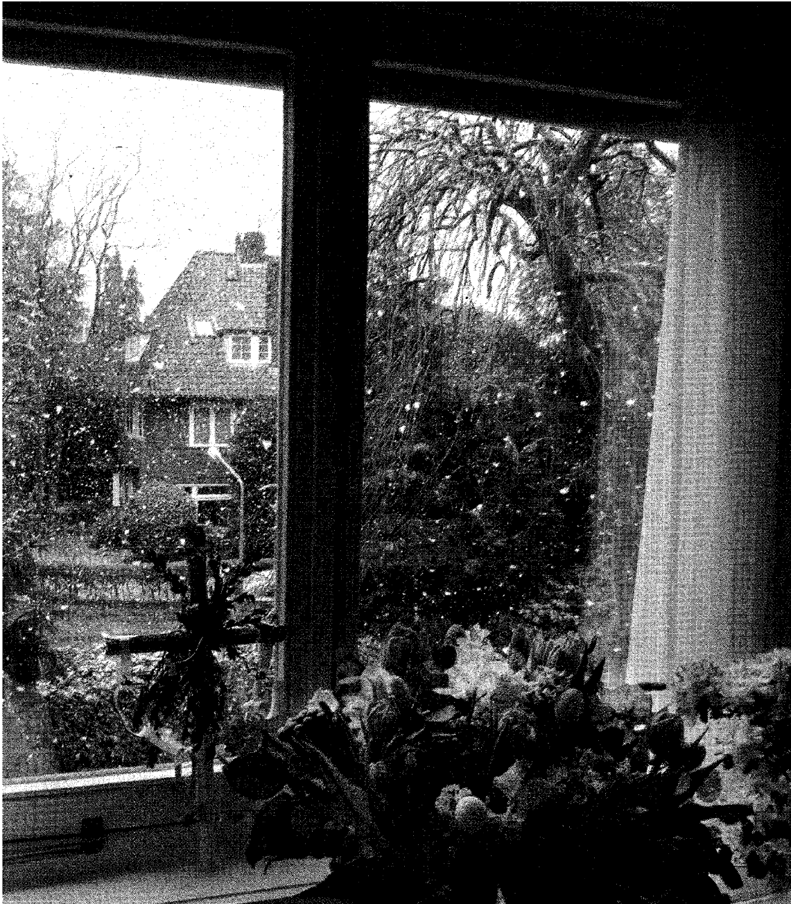
Uitzicht uit een kamer van een hospice in Hilversum.